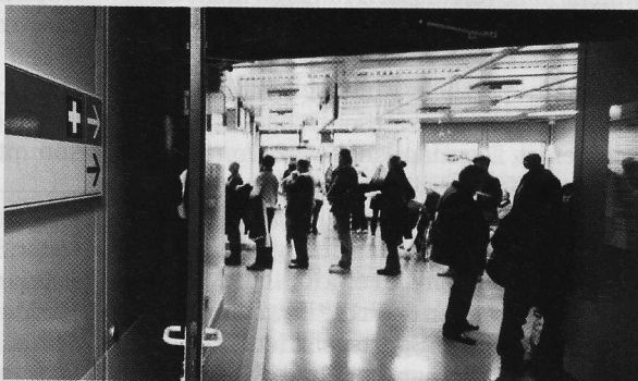
SPITALSAMBULANZEN. Jährlich 16 Millionen Patienten.