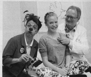
ANGSTFREIE BEHANDLUNG. Rote Nasen bringen zum Lachen.