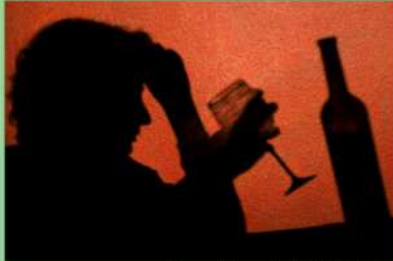
Suchtmittel: Einnahmen weit höher als soziale Folgekosten.